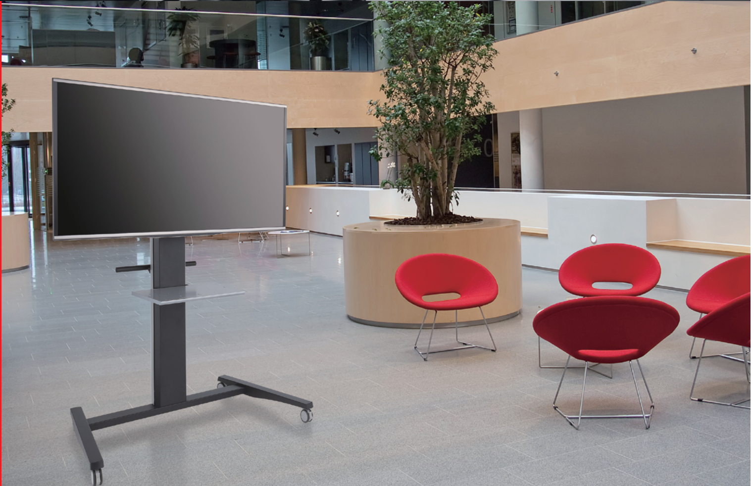
Big KANI + / 60 インチディスプレイ設置