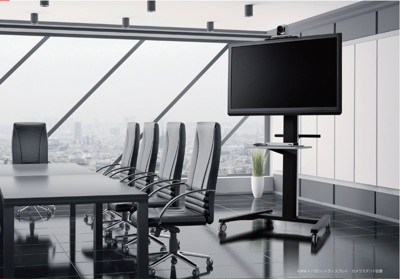
KANI + / 50 インチディスプレイ・カメラスタンド設置